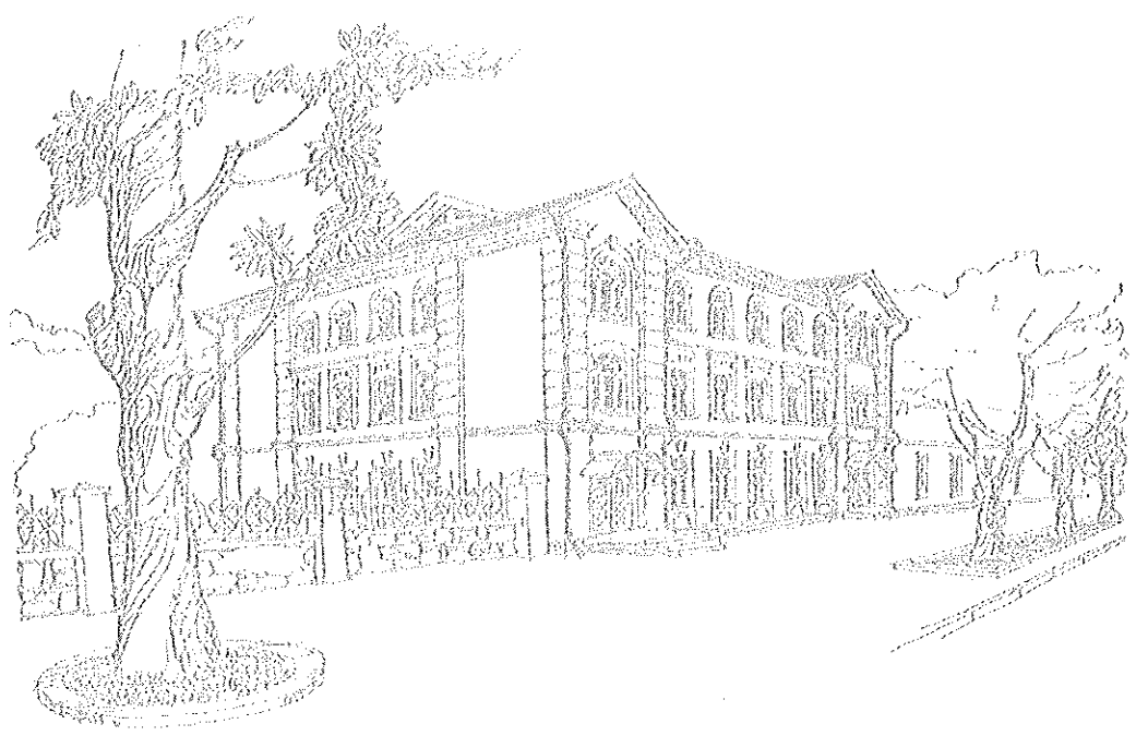
Sesizare privind excepția de neconstituționalitate