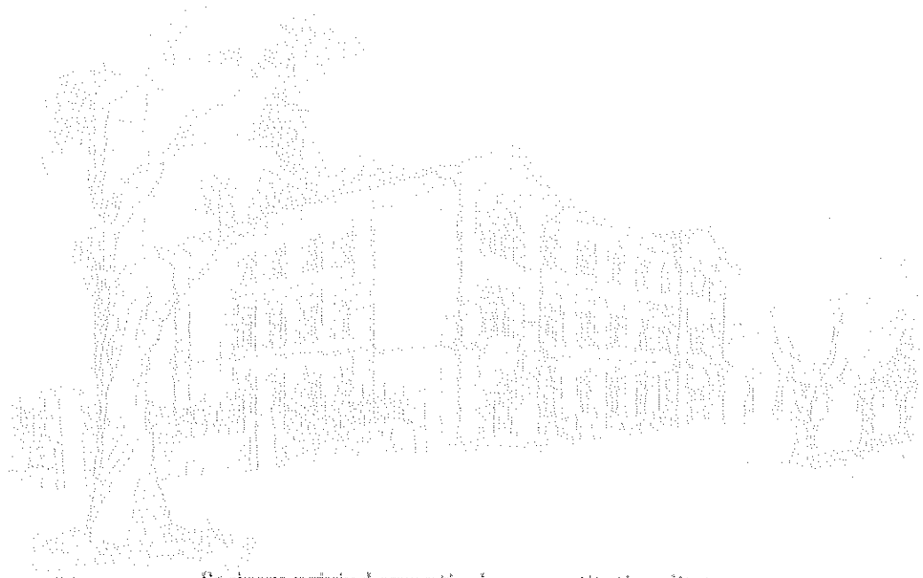
Sesizare privind excepția de neconstituționalitate